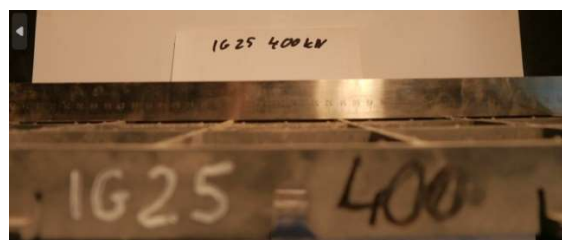
Fot.6. kraty IG 25 po obciążeniu 400kN