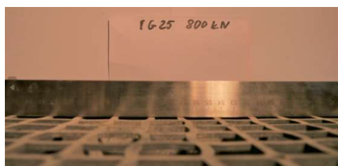
Fot.7. kraty IG 25 po obciążeniu 800kN