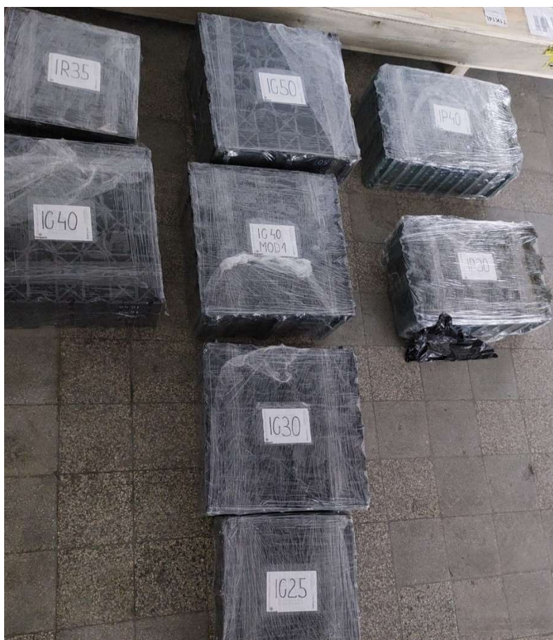
Fot. 1 Próbki do badań

Próbki dostarczono na palecie. W trakcie rozpakowywania nie stwierdzono żadnych uszkodzeń.