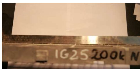
Fot.5. kraty IG 25 po obciążeniu 200 kN